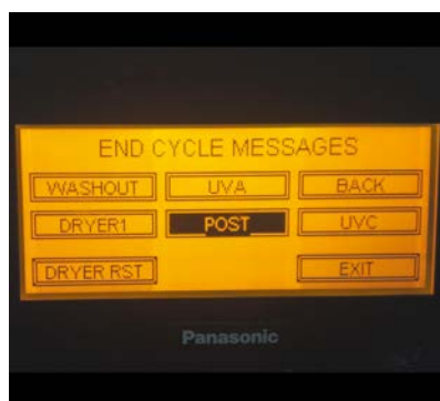
タッチスクリーン操作パネル