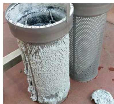
交換が容易なフィルターシステム