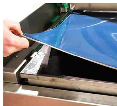
交換が容易な粘着シート