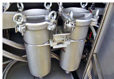
フィルターシステム