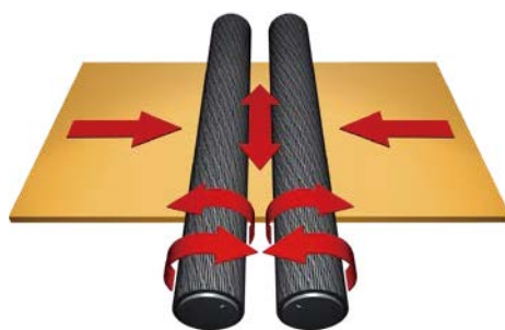
製版プロセスイメージ図