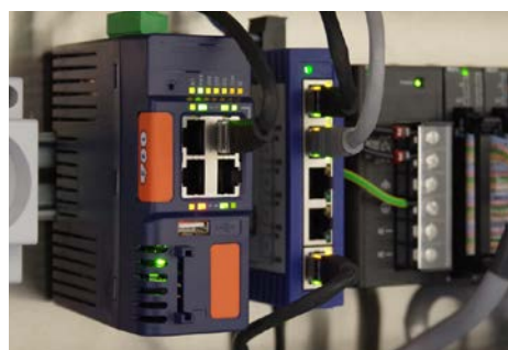
リモートアクセス用モデム