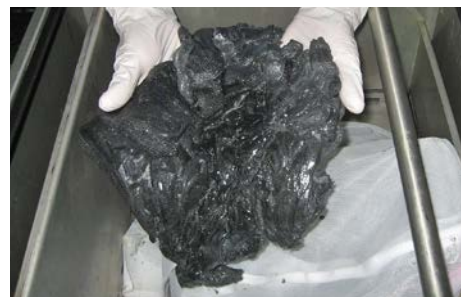
回収樹脂イメージ