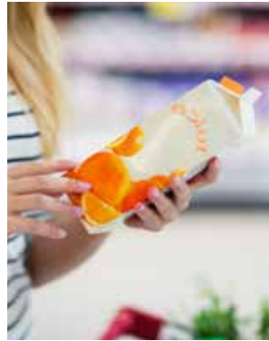
AWP™-DEW: mit EGP