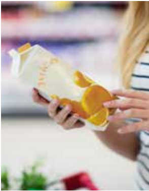
Andere Platte: CMYK + SPOT

Da das Drucken im erweiterten Farbraum (EGP) auf dem Flexodruckmarkt immer weiter Verbreitung findet, werden Druckplatten mit exakter Registerhaltigkeit und einer stabilen Druckqualität benötigt. Die AWP™-DEW, gib dem Druck mit fester Farbpalette, ein neues Zuhause, da sie völlig auf Lösemittel mit flüchtigen organischen Verbindungen (VOC) und hohe Trocknungstemperaturen verzichtet, die die Dimensionstabilität der Platte beeinträchtigen können.